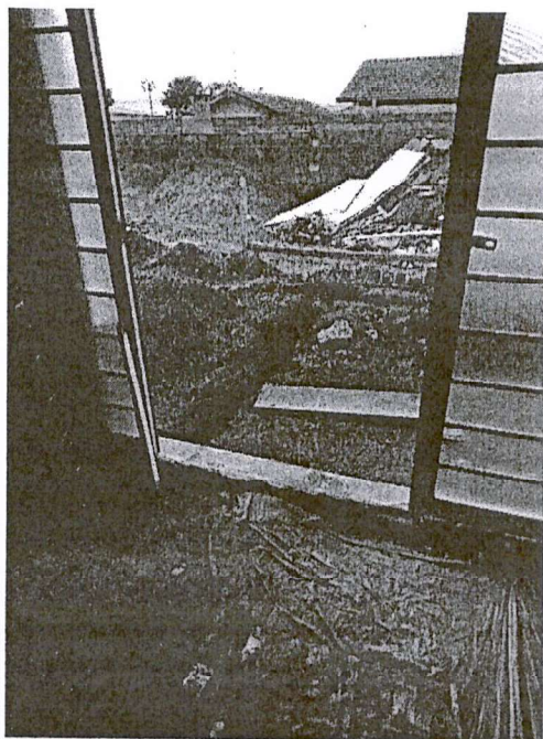
Fotos do dia 23/01/2025 da entrada do CSE - Unidade da Vila Ferroviária